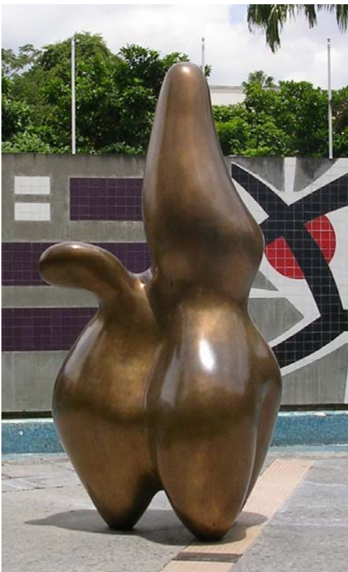
Jean Arp, Cloud Shepherd , 1953.