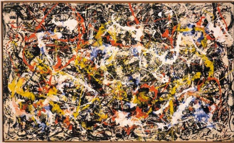
Action painting: Jackson Pollock, Convergence , 1952.