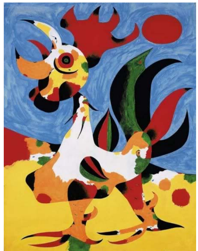
Joan Miró, Le Coq , 1940.